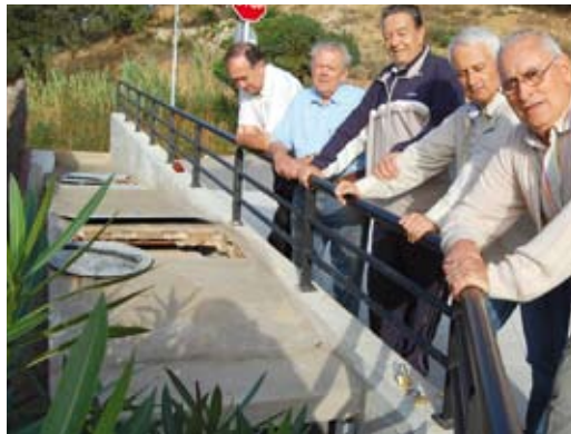
Tres dels minaires, amb tècnics municipals, davant de les noves instal·lacions de la mina.