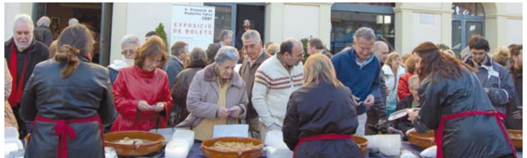
La degustació dels productes típics, en una imatge d'arxiu. Aquest any es farà al passeig de la Mare de Déu de Montserrat.

Els propers 22 i 23 de novembre, a més de comprar i degustar els productes típics de tardor, també es podrà visitar la tradicional exposició de bolets i participar en tot un seguit d'activitats dedicades als infants.