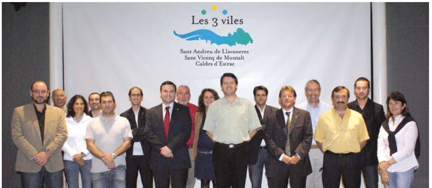
Alcaldes i regidors de govern de Les 3 viles , en una fotografia de família, al final de la trobada del 13 d'octubre, que es va fer a Caldes.

Fins avui ja s'ha treballat conjuntament, i amb èxit, en àrees com la Policia Local, Promoció Econòmica, Joventut, Esports o Ensenyament. Ara l'entesa vol ampliar-se a serveis generals, com són la neteja dels edificis municipals i de les platges. Es tracta de negociar contractacions per als tres ajuntaments amb l'objectiu d'abaratir costos. Les 3 viles també volen compartir experiències en altres camps, com la neteja viària, la tinença responsable d'animals domèstics o la gestió de zones blaves i aparcaments. Un altre repte és aconseguir unir els tres municipis amb un nou passeig marítim comú que doni continuïtat al litoral. En cada cas caldrà signar un conveni específic. L'acord marc tindrà vigència per a tot el mandat.