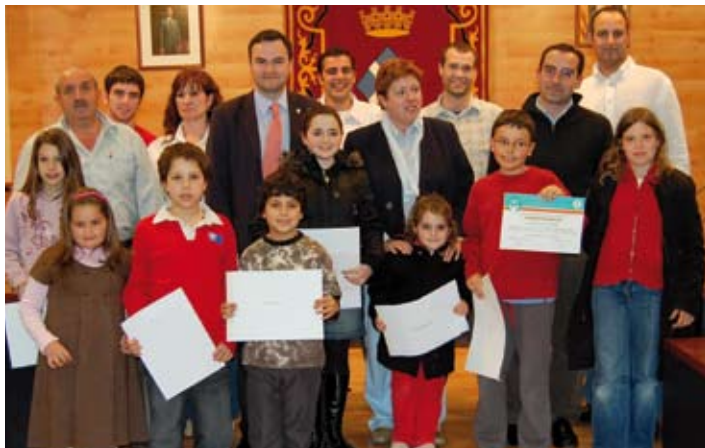
Lliurament de premis.

L'organització continua avançant en els preparatius de les Olimpíades i ja ha anunciat que el període d'inscripcions serà del 5 de maig al 27 de juny.