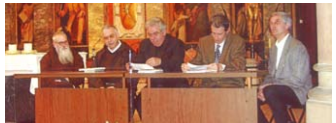
La presentació de la biografia del cardenal Vives.

prevista una segona presentació a Barcelona. L'edició d'aquest llibre s'ha fet possible gràcies al suport de més de 350 subscriptors, entre els quals hi ha membres d'honor, com ara l'arquebisbe de Barcelona, i institucions públiques, tot i que la gran majoria són particulars de diferents punts de Catalunya, sobretot de Llavaneres, i també de l'estranger. Ara, el pròxim repte serà aconseguir portar part de les despeses del cardenal a Llavaneres.