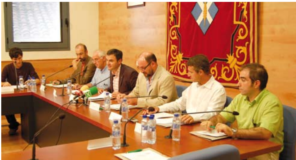
Un moment de l'acte de constitució de la Junta Electoral de l'Ajuntament Jove Electrònic, el passat 18 de setembre.

Amb l'objectiu de promoure les noves eines i instruments de la societat de la Tecnologia de la Informació i la Comu-