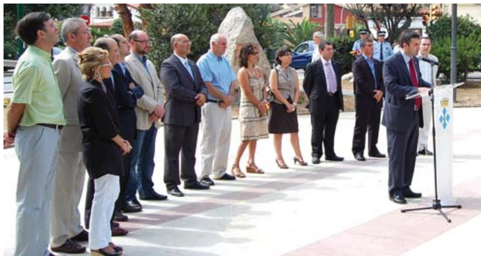
La corporació municipal en bloc va assistir a la celebració de la Diada