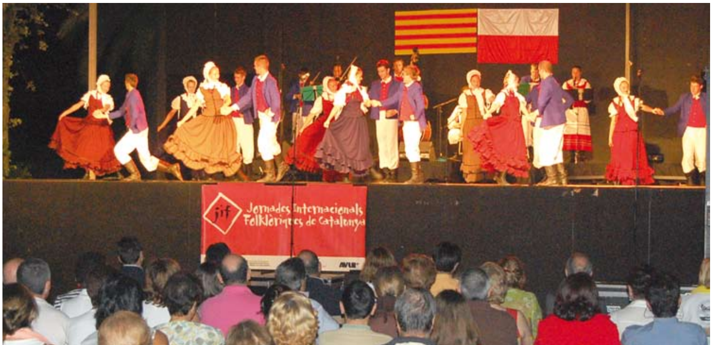
La formació polonesa durant la seva actuació a Llavaneres.

Des de la seva creació, el grup ELK ha ofert prop de vuitanta concerts a Polònia i a d'altres països. L'any 2005 el grup va obtenir el certificat de CIOFF, el Consell Internacional de les Organitzacions de Festivals Folklorics i d'Arts Tradicionals.