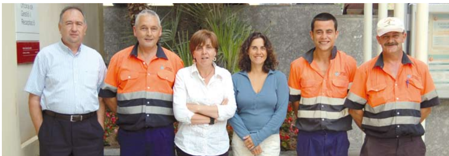
El personal del Servei Municipal d'Aigües.