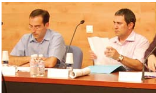
El regidor de Promoció Econòmica va explicar l'ordenança al darrer ple municipal.

via un locutori al municipi, però darrerament l'Ajuntament ha rebut sol·licituds per obrir-ne de nous, situació que ha motivat la regulació d'aquest tipus d'establiments.