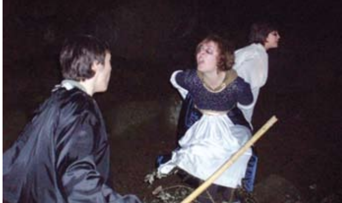
La nit de por va oferir un terrorífic passeig pel bosc.

ció de més de 80 persones, sumant-hi membres d'Acció Juvenil, de l'ADF Serralada de Montalt, d'Adventures Llavaneres, d'Els Banyuts de Llavaneres i voluntaris de l'IES Llavaneres, amb el suport de la Regidoria de Joventut.