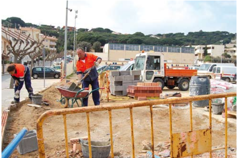
Operaris de la brigada municipal treballant a primers de març en el camp de futbol vell.

que actualment queda tallada. A més, s'eliminaran les barreres arquitectòniques dels dos passos de vianants de davant del camp de futbol vell. L'actuació es completarà amb l'habilitació d'una zona de càrrega i descàrrega comercial.