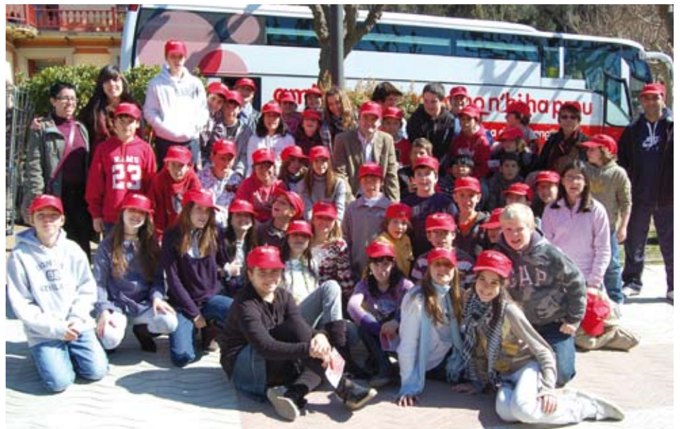
Escolars i organitzadors de la campanya especial de donació de sang.

Excel·lent resultat de la campanya de donació de sang que el 6 de març va portar a terme el Banc de Sang i Teixits a Llavaneres, amb la col·laboració dels alumnes de 6è de primària del CEIP Sant Andreu. Els escolars van liderar la campanya de divulgació, fet que va contribuir a aconseguir batre el rècord: 46 persones van donar sang, 15 de les quals es van estrenar com a donants. Fins el bus es van acostar altres tres persones que, per diferents motius, no van poder donar sang. La jornada es va fer coincidint amb el mercat setmanal dels divendres, al passeig de la Mare de Déu de Montserrat, en un dia ben assolat que convidava a sortir al carrer. La campanya va començar amb sessions teòriques a les aules i ha comptat amb la col·laboració de la Regidoria de Sanitat de l'Ajuntament de Llavaneres. Els alumnes han pres consciència de la necessitat de la donació de sang i hi han implicat tothom del seu entorn.