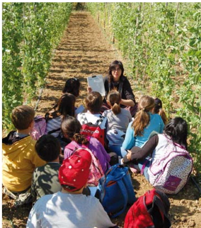
Degustació de pèsol garrofal en la Festa del Pèsol del 2008 i alumnes del CEIP Sant Andreu visitant l'hort de Can Graupera, el passat dilluns 23 de març.