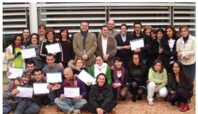
A la fotografia, la cloenda del primer curs de monitors de lleure.

L'activitat, l'organitzen les Regidories de Promoció Econòmica, Joventut i Ensenyament de l'Ajuntament de Llavaneres.