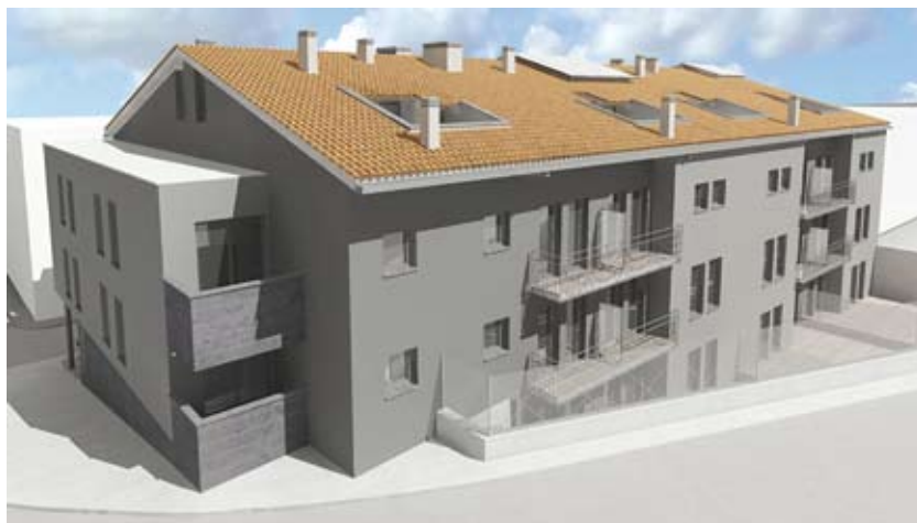
Imatge virtual de la futura promoció de pisos socials del carrer de Sant Antoni.

dico-patrimonial i econòmica de la promoció d'habitatge protegit del carrer Sant Antoni 2-4. El pas següent serà l'elaboració del quadre de característiques de l'obra, procediment previ imprescindible per a licitar l'actuació. Com en el cas de Can Rivièrè, el contracte consisteix en l'alienació del solar i l'empresa que en resulti adjudicatària assumirà la construcció dels pisos i la gestió de la promoció.