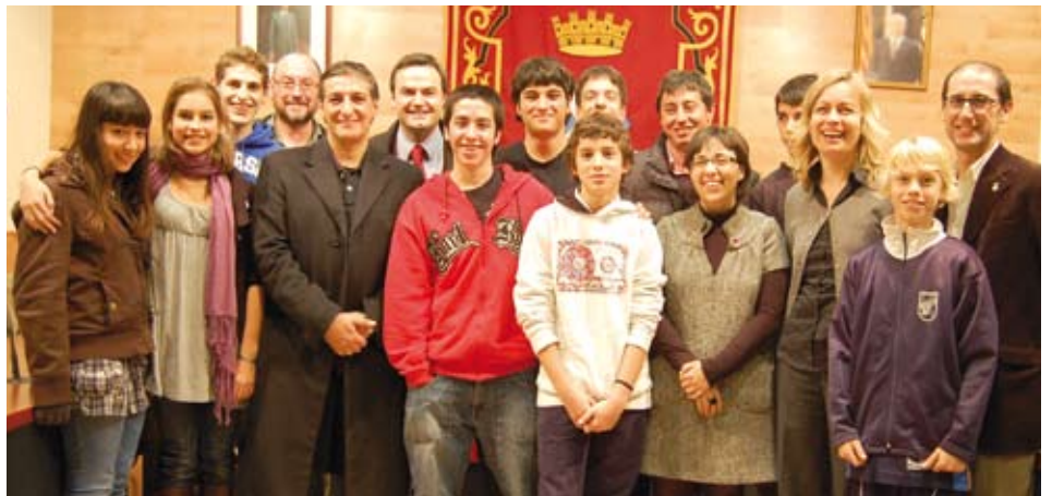
Alcalde i regidors joves, acompanyats de representants municipals i de les seves famílies, al final del ple jove del 19 de desembre.

En darrer terme, no es van oblidar de demanar que es dotés econòmicament la partida de l'Ajuntament Jove, per tal de tirar endavant els projectes proposats i, alhora, l'aprovació del reglament del Consell de Joves, que prendrà el relleu a l'Ajuntament Jove com a interlocutor entre joves i Consistori.