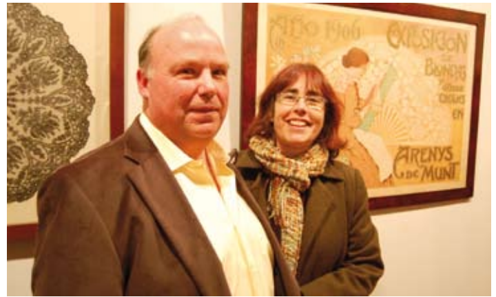
L'exposició dedicada a les puntaires de Llavaneres, al Museu-Arxiu.