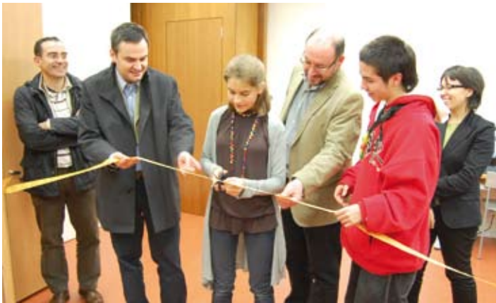
Inauguració del Punt Jove a la Biblioteca, amb l'alcalde i la regidora jove.