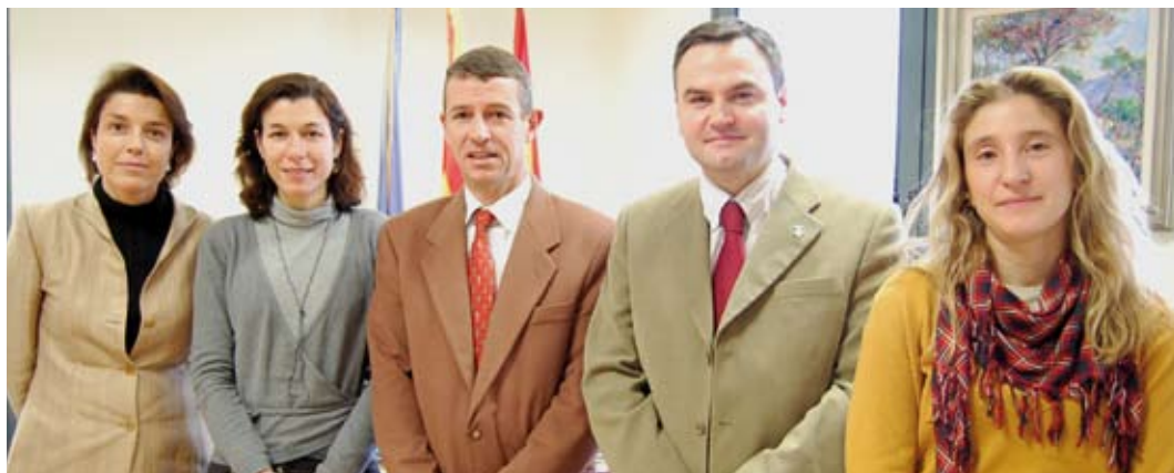
L'alcalde i el secretari municipal, acompanyats de les tècniques adjuntes a Alcaldia i Secretaria.

L'àrea de Secretaria s'encarrega d'elaborar les convocatòries, ordres del dia, actes, resolucions i acords dels diferents òrgans de govern. Així mateix, gestiona l'exposició pública dels acords municipals a través dels diaris oficials i del tauler d'edictes de l'Ajuntament. S'ocupa també de la contractació administrativa de béns, serveis i subministraments municipals.