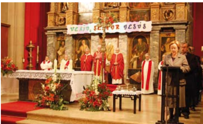
Ofici solemne en honor a Sant Andreu al temple parroquial.