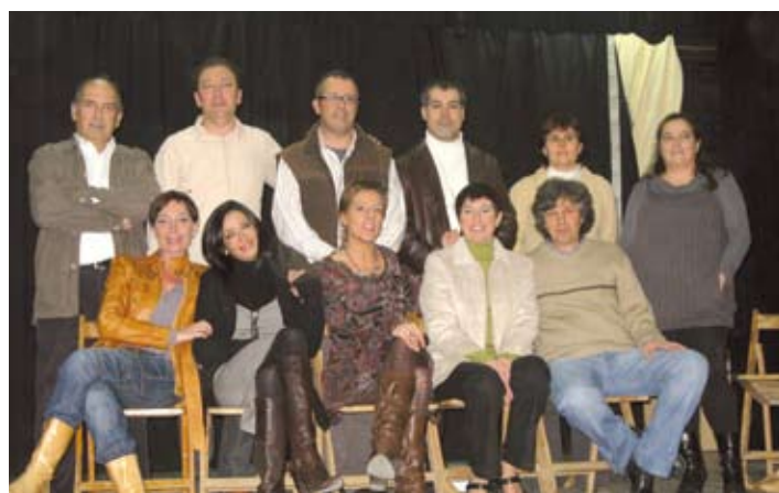
Teatre a càrrec de la companyia Inestable d'El Casal de Llaveneres.