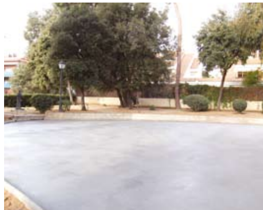
Aquí es col·locarà la half , perquè els joves practiquin skate .