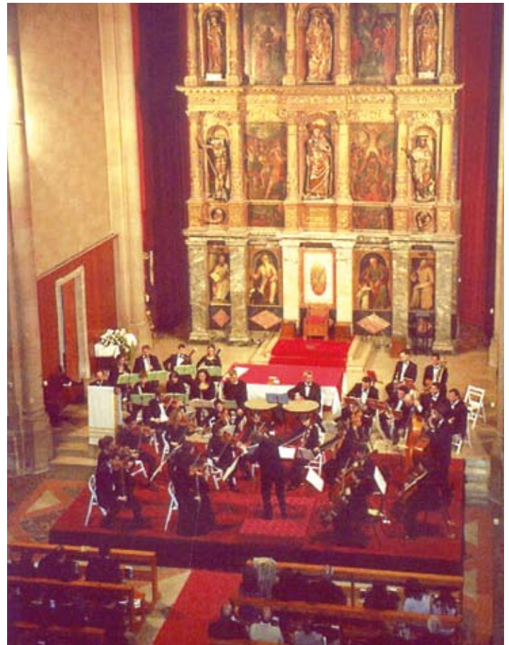
El concert de Camerart-Orquestra del Maresme en record de Beethoven.