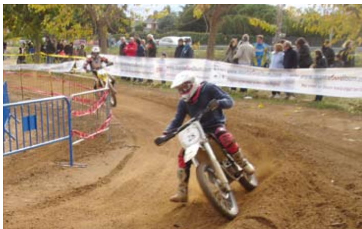
17a Tres Hores de Resistència de Ciclomotors.