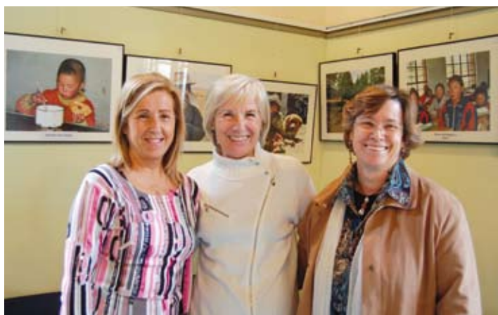
Exposició de Rokpa, a Ca l'Alfaro.