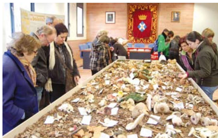
Exposició de bolets, a la sala de plens.