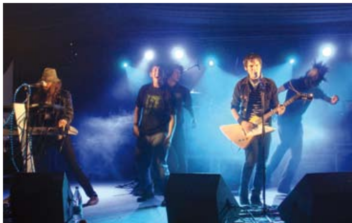
Nit Jove a l'envelat.