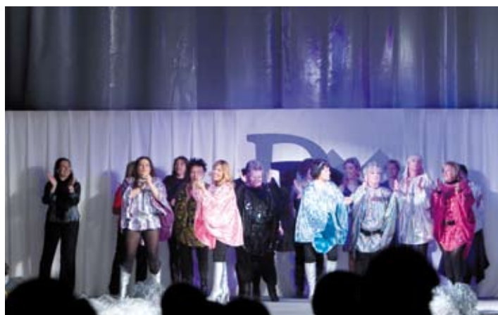
10a Desfilada Tope Models, de la Dona per la Dona.