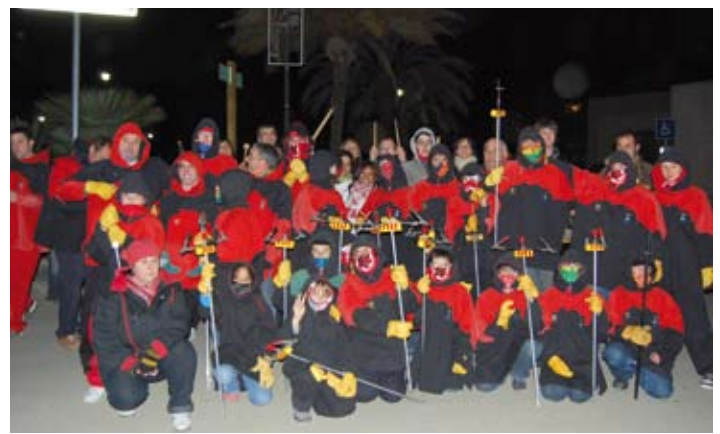
L'equip del correguspira d'Els Banyuts, abans de començar l'actuació.