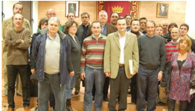
Foto de família amb els primers voluntaris de la nova etapa de Ràdio Llavaneres, després de la reunió informativa.

l'acord pel lloguer de l'espai. El pas següent serà contractar una empresa que instal·li els equips necessaris per a la reobertura de l'emissora. A partir d'aquí caldrà nomenar un/a director/a i aprovar el model de ràdio. La previsió és que l'emissora funcioni a través del voluntariat i que combini informació, entreteniment i música. Tot aquest procés es farà d'acord amb l'organisme autònom de Ràdio i Televisió de Llavaneres.