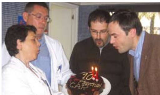
La direcció del CAP de Llavaneres i l'alcalde bufen les espelmes dels deu anys.

metge que atenia dues hores al dia als vilatans. Ara, la cobertura és total, i a més de l'atenció mèdica a les instal·lacions del centre, també s'ofereixen serveis complementaris. El CAP del municipi dona servei d'urgències als habitants de Sant Vicenç de Montalt i de Caldes d'Estrac els dies festius, els caps de setmana i dels dies feiners entre les 8 del vespre i les 9 del matí.