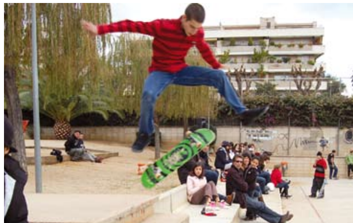
4a Festa del skate al parc de Sant Pere.