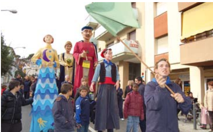
Cercavila de gegants pels carrers del poble.