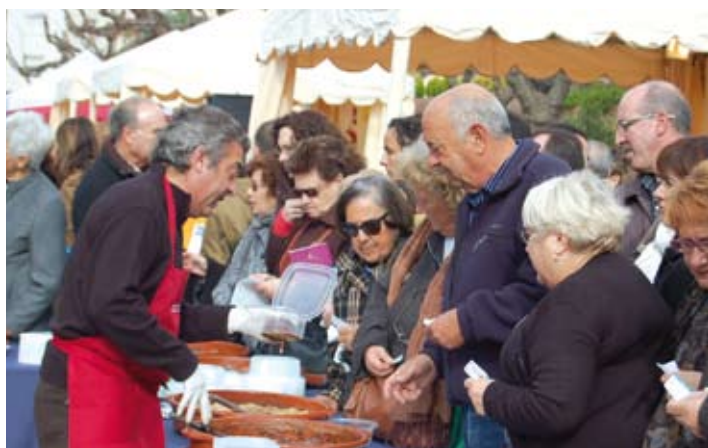
Degustació popular de pomes farcides, coca de Llaveneres i bolets.