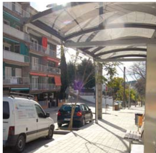
Detall de la col·locació de la nova marquesina davant dels pisos Tordera.