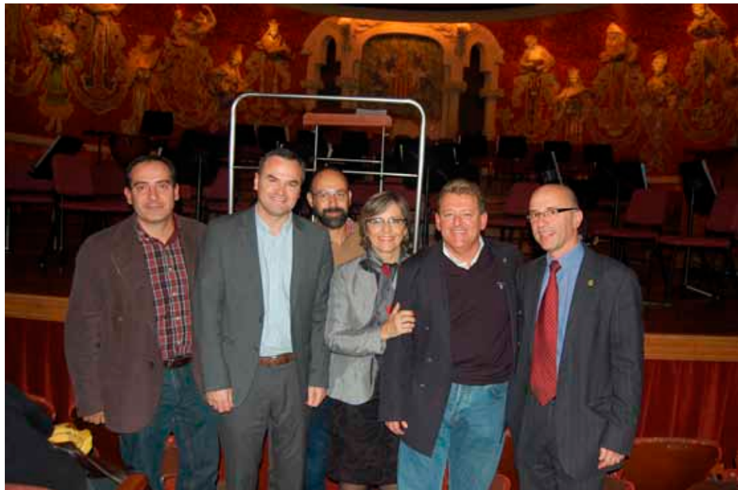
Foto de família de regidors i alcaldes del Maresme en el concert del 10 de novembre al Palau de la Música Catalana, amb Camerart i la Coral Sant Jordi.