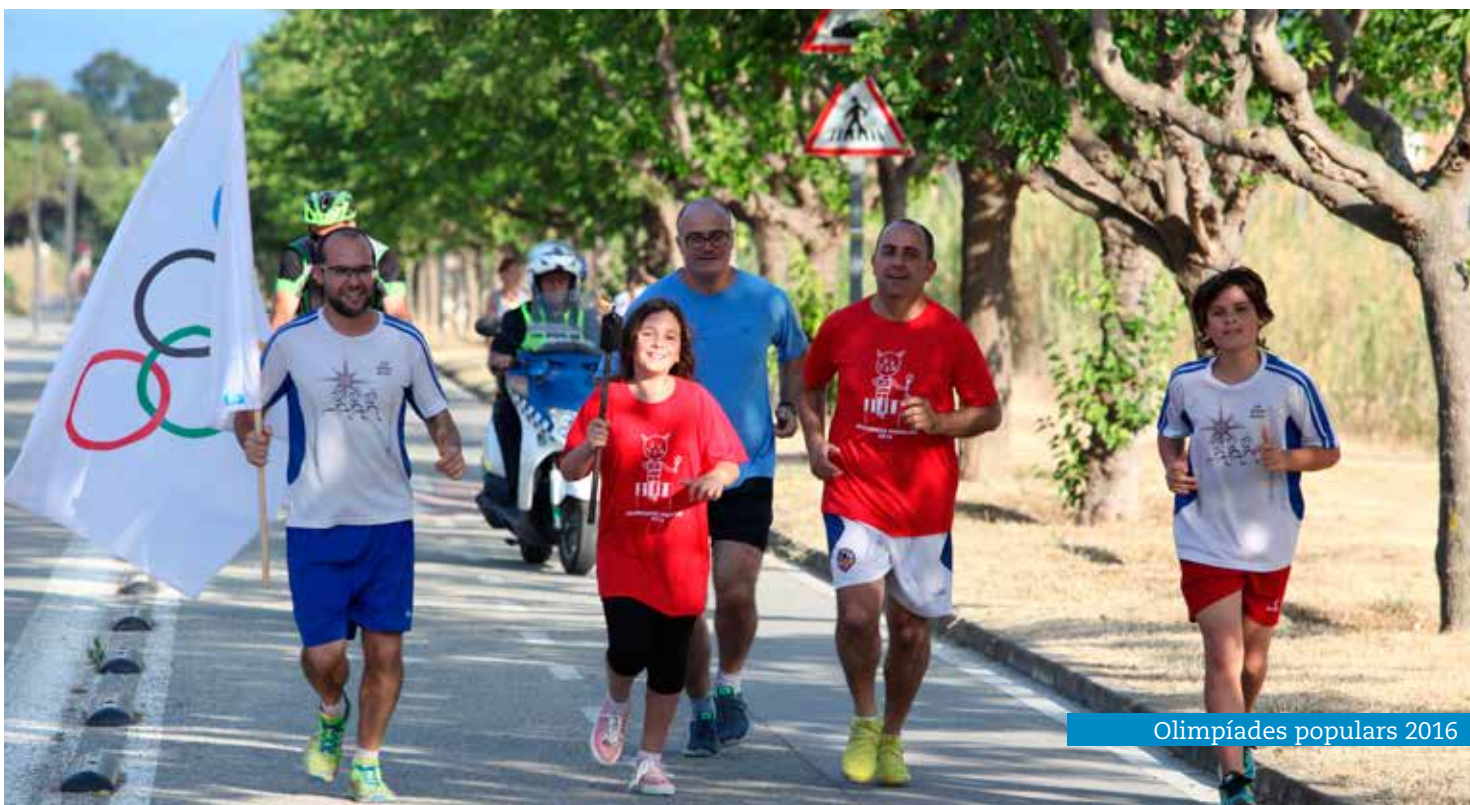
Olimpiades populars 2016