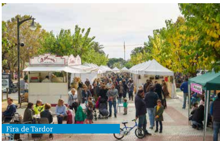
Fira de Tardor