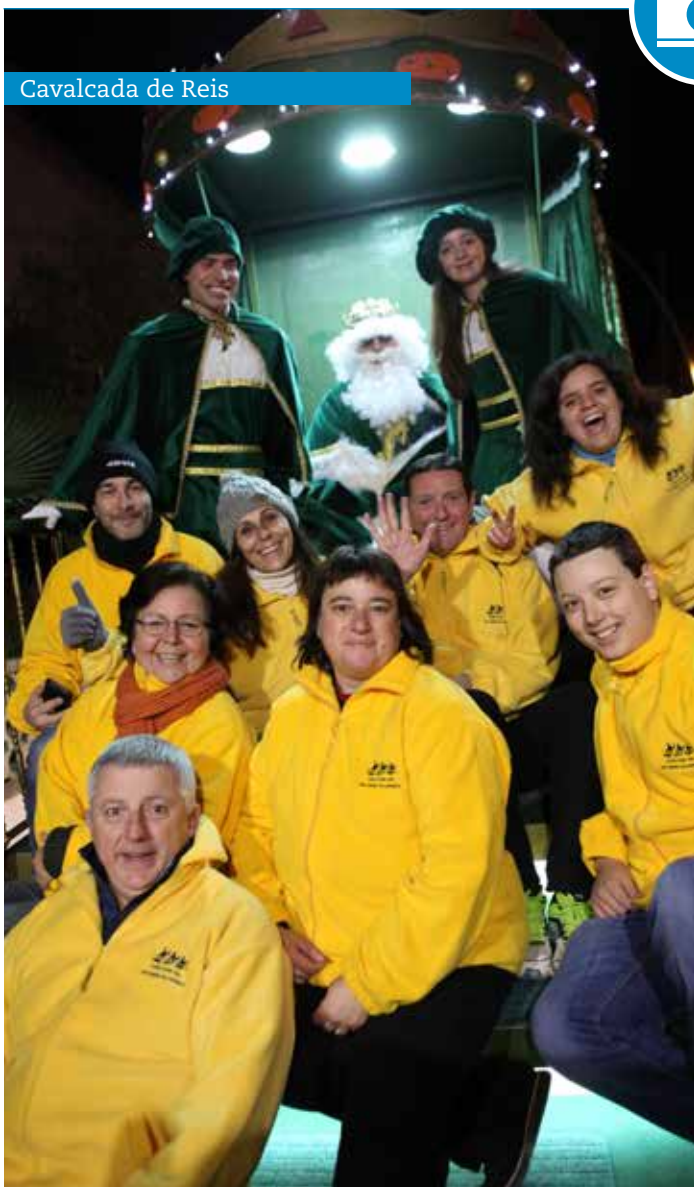
Cavalcada de Reis