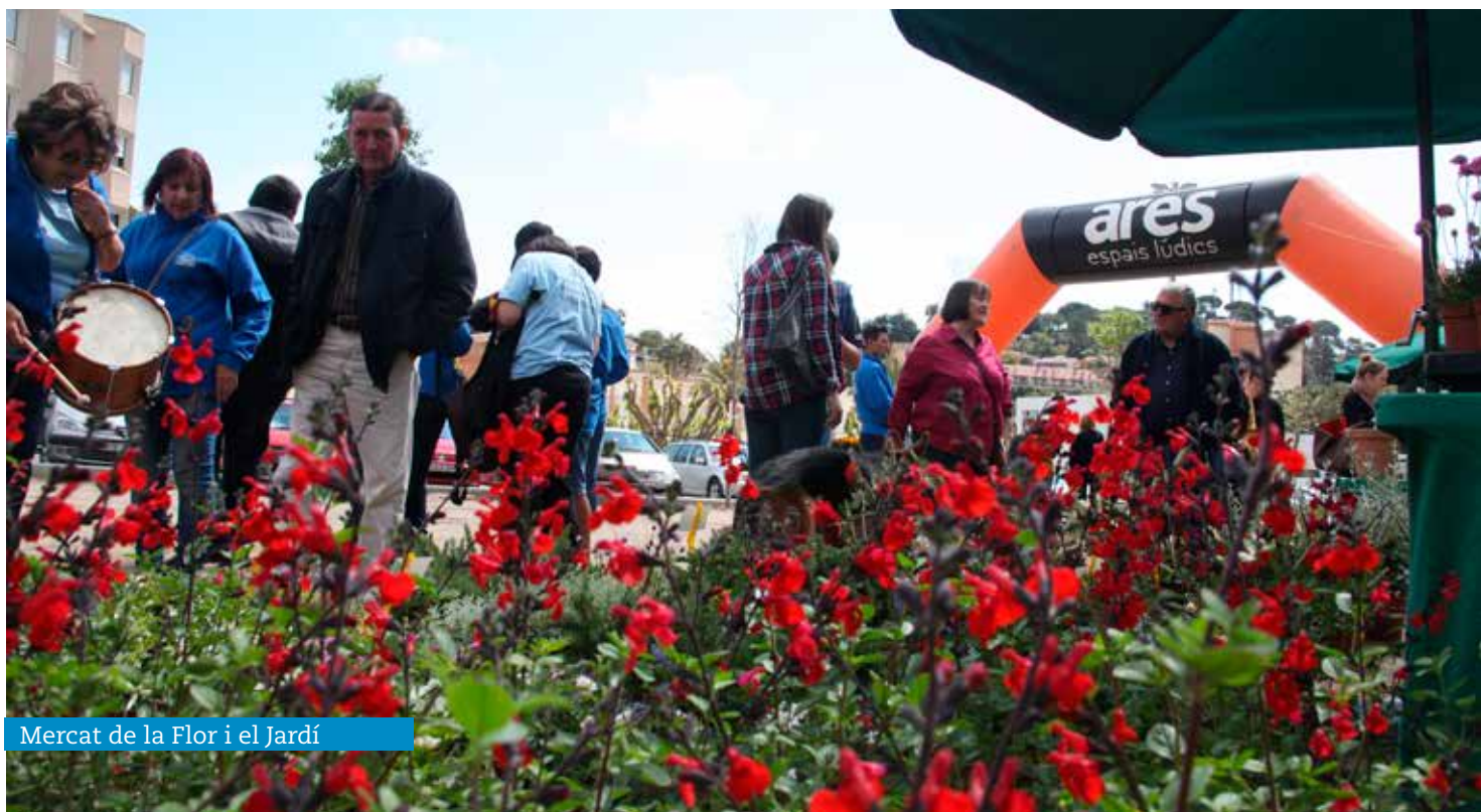
Mercat de la Flor i el Jardí