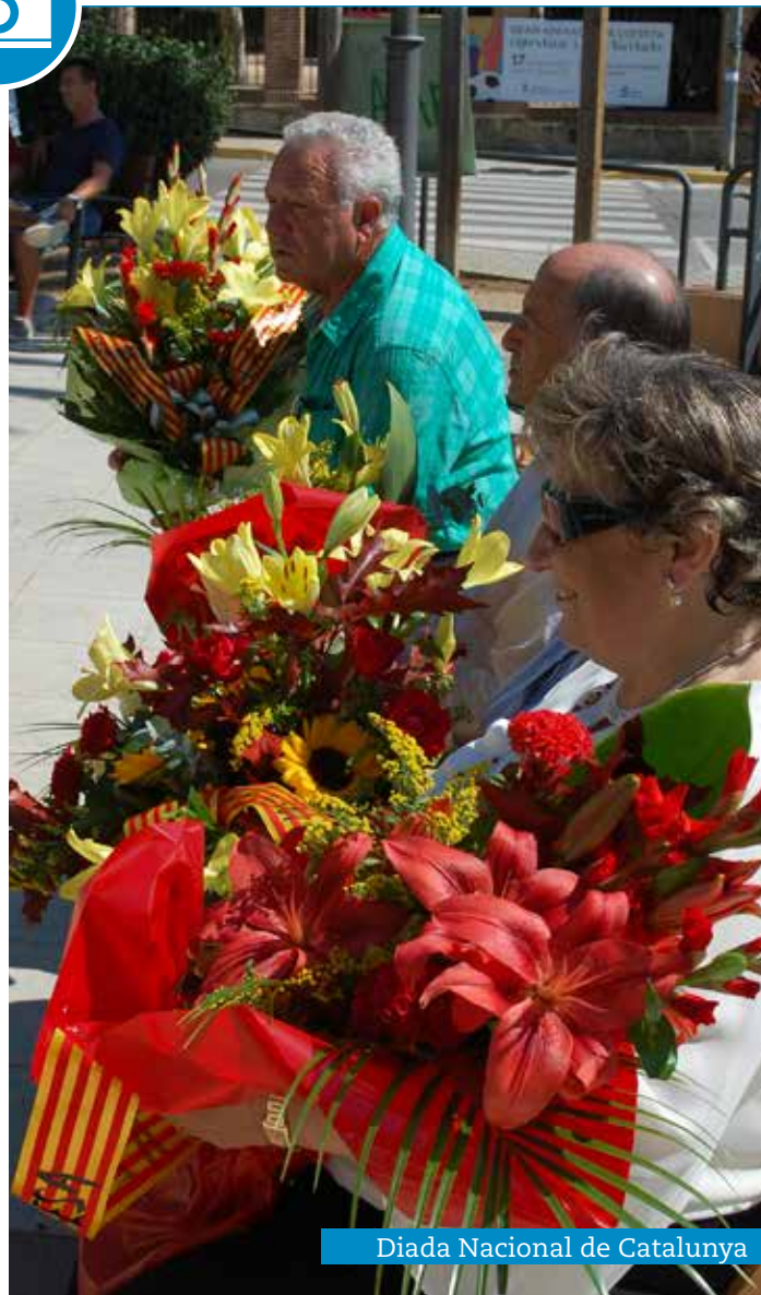
Diada Nacional de Catalunya