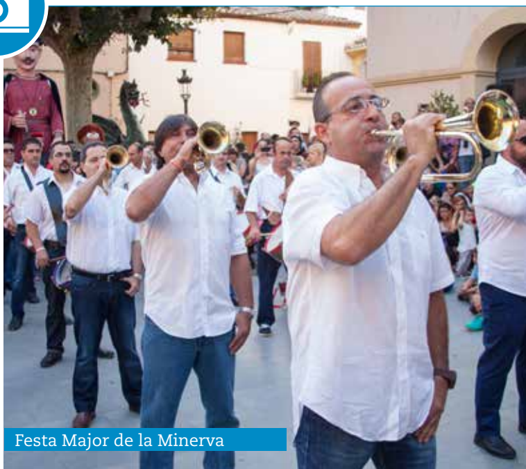
Festa Major de la Minerva