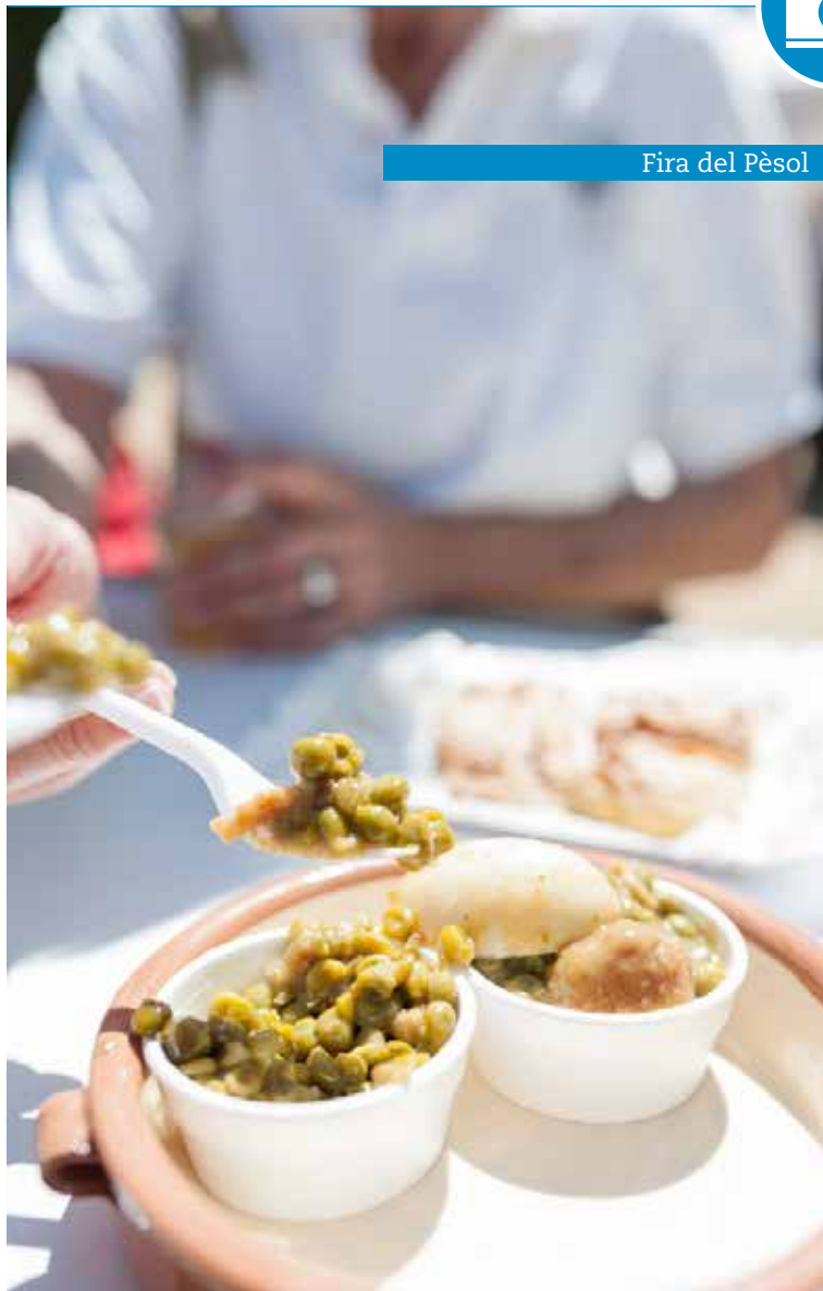
Fira del Pèsol