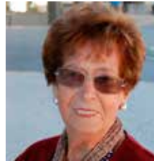
Segunda Barrante Veïna del centre

“Solucionarem molts problemes del dia a dia, estalviarem energia i complirem amb la normativa europea de contaminació lumínica”