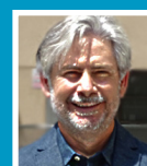
XAVIER NOMS REGIDOR DE CULTURA

desembre van seguir els actes per recollir fons per a aquesta iniciativa solidària, amb tallers, jocs, esports, venda de ponsèties, joguines i dolços al parc de Ca l'Alfaro.