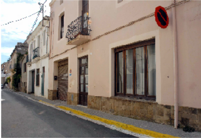
Carrer de Sant Antoni on es construiran pisos protegits

El Consistori ha aprovat, en ple municipal, el llistat provisional d'admesos i exclosos del procés d'adjudicació i venda dels habitatges situats als sectors de Can Rivièr i el carrer de Sant Antoni.